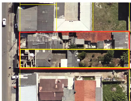
Vista aérea demarcada em amarelo